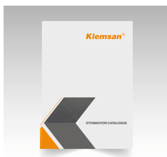
Каталог приборов для автоматизации

Пожалуйста, обратитесь за каталогами к нашим представителям или скачайте в формате PDF с нашего сайта: www.klemsan.com