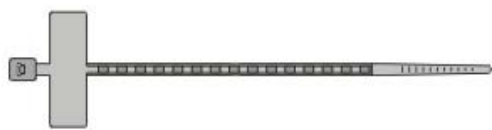
YKB MCV 2,5x100, YKB MCV 2,5x200S, YKB MCV 2,5x200SS