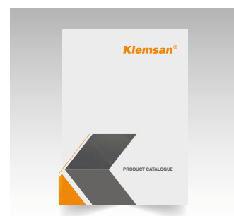
Каталог электротехнической продукции